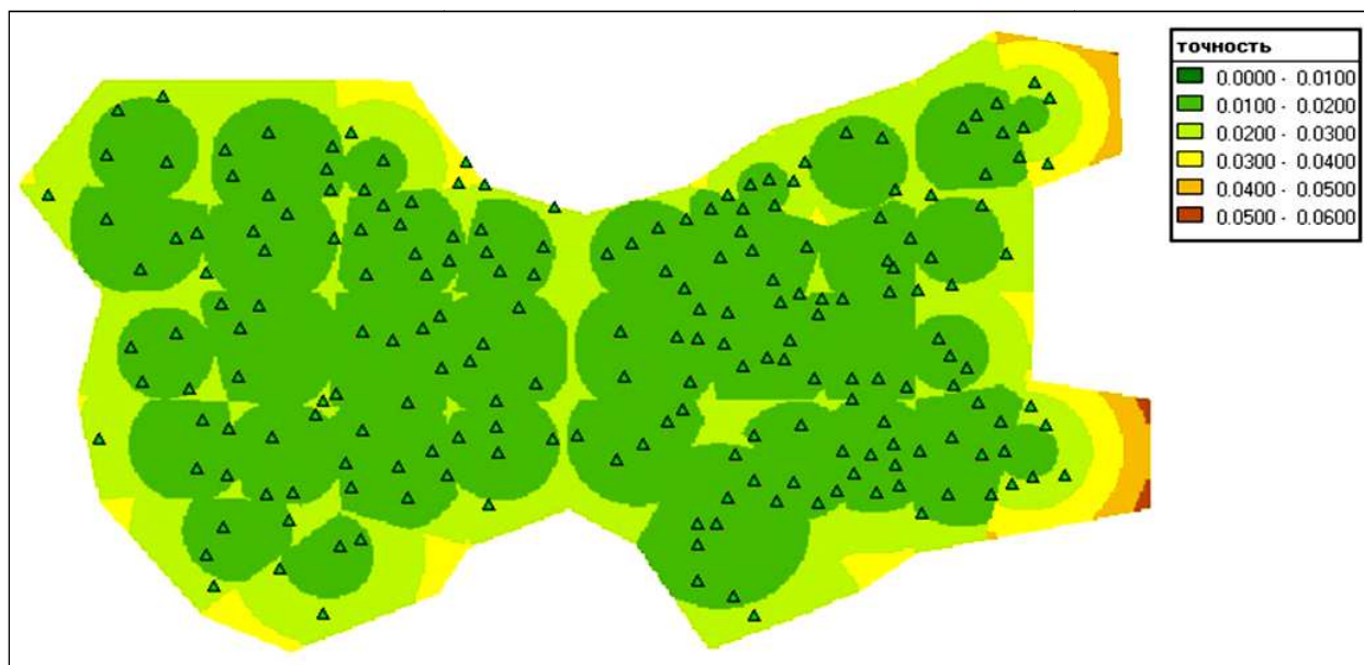
Рис. 3. Карта убывания точности преобразования (в метрах) по мере удаления от групп исходных пунктов